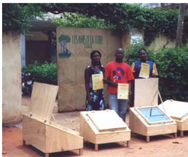
Abb. 12: Kochkisten bauen in Togo – Studenten mit ihren Zeugnissen und den Sonnenöfen am Ende des Baukurses vor dem Sitz der Umweltschutzgruppe „Les Amis de la Terre“.