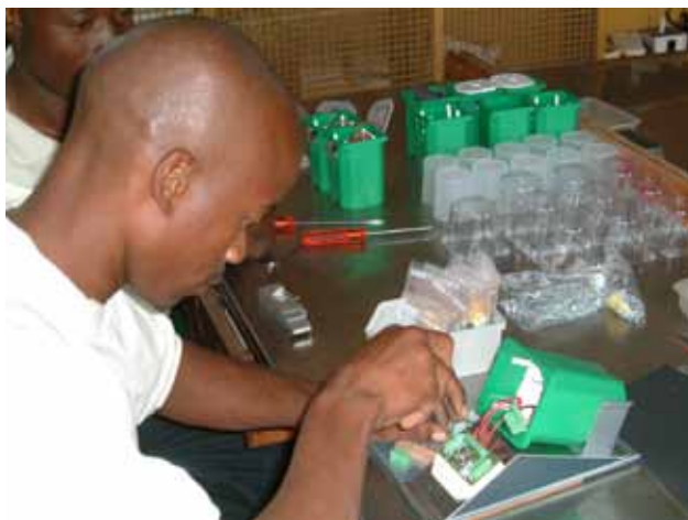
Abb. 6: Endmontage der Solar 2007-2 in Tansania.

Projektkosten: rund 3.800 € für 50 Bausätze und Werkstattausrüstung, ca. 3.450 € für weitere 50 Bausätze. Weitere direkte Kosten fielen nicht an. Der für den Projektaufbau zuständige Volontär wurde vom BMZ bezahlt, der Kurs beim Solarprojekt Freilassing e.V. war kostenlos. Raumkosten entfallen ebenfalls, da die Werkstatt beim Projektpartner Fondation Stamm untergebracht ist. Personalkosten (Werkstatt, Verleih) werden durch Mieteinnahmen finanziert.