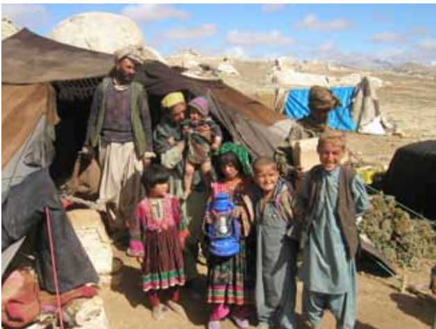
Abb. 14: „Nomaden-Kits“ machten im Rahmen des Projekts „Licht für Afghanistan“ Solartechnik mobil.

Hauptziel des ABS ist die Mitwirkung beim Wiederaufbau in Afghanistan, wobei die Förderung des Umweltschutzes, der Bildung und der Entwicklungshilfe zentrale Anliegen sind. Der Verein konzentriert sich vor allem auf