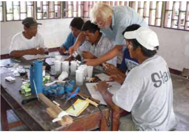
Abb.: 3 Die Werkstatt in San Martin de Tipishca.

Ökotourismus. Projekte zur Aufforstung sowie zur Fisch-, Hühner- und Gemüsezucht wurden bereits begonnen. Maßnahmen für moderne Kommunikationswege und Hilfen für eine bessere Ausbildung sind ebenfalls notwendig.