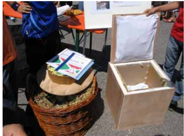
Abb. 20: Warmhaltekorb und Länderberichte aus dem Wettbewerb