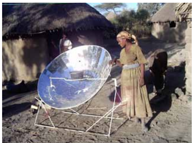
Abb. 8: SK14-Kocher im Einsatz, hier in Äthiopien.

Die Solargeräte, insbesondere die Solarkocher entwickelt EG Solar zusammen mit der Berufsschule Altötting laufend weiter. Als Basis dienen die Verbesserungsvorschläge, die in den Werkstätten und bei den zahlreichen Solarkocherprojekten in aller Welt gesammelt werden.