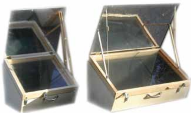
Abb. 11: ULOG-Sonnenöfen, Modelle Standard und Familia.

Die Sonnenofenmodelle von ULOG: Der Standardofen kostet 250 €, das Modell Familia 290 €. Im Onlineshop kann man außerdem Solarkocher, Solarmodule und kleine PV-Anlagen kaufen – fertig montiert oder im Selbstbau- und Lern-Set. Dazu gibt es Solarlampen und solare Handylader, Kochbücher, Kochtöpfe, Thermometer und sonstiges Zubehör.