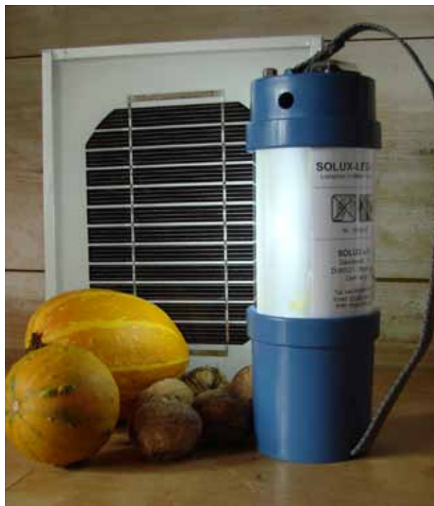
Abb. 1: LED-Solarlampe Modell SOLUX-LED-100

SOLUX hat bereits 60 Werkstätten vor allem in afrikanischen Ländern, aber auch in Südamerika und Asien ausgerüstet. Mehr als 50.000 Leuchtensysteme wurden dort inzwischen aus Bausätzen produziert bzw. als Fertigprodukte dorthin geliefert. Dabei kooperiert SOLUX mit karitativen und kirchlichen Einrichtungen, staatlichen Stellen und Nicht-Regierungsorganisationen (NGOs) – darunter kleine Eine-Welt- und Lokale-Agenda-21-Gruppen, wie auch international agierende Entwicklungshilfeorganisationen, etwa die frühere GTZ (Deutsche Gesellschaft für technische Zusammenarbeit, Eschborn, inzwischen fusioniert zur GIZ, Gesellschaft für internationale Zusammenarbeit, siehe Kapitel 1.1). Durch Miet- und Ratenzahlungen, etwa in Höhe der bisherigen Petroleumkosten, sollen die Nutzer