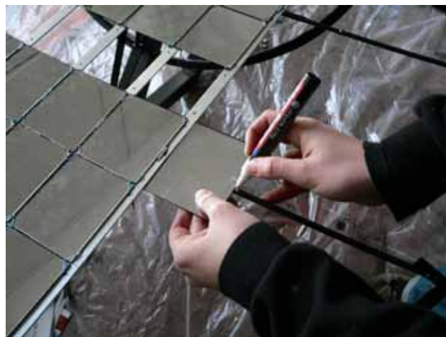
Abb. 13: Die Solare Brücke baut solare Großküchen in Entwicklungsländern auf, stellt ihr Know-how aber auch in Form von Bauanleitungen zur Verfügung.

Die Grundidee des Vereins ist, Projektpartner in Entwicklungsländern mit Know-how zu unterstützen, damit selbstständige, von Einheimischen geleitete Werkstätten die solaren Technologien im eigenen Land verbreiten können. Zentrales Element ist eine partnerschaftliche Zusammenarbeit. Die Projekte sollen langfristig zu Selbstläufern werden, weder finanzielle noch technologische Abhängigkeiten sollen entstehen. Die Kontakte bleiben jedoch erhalten, um Techniken gemeinsam weiterzuentwickeln oder neue Anwendungsformen und Einsatzbereiche zu erschließen.