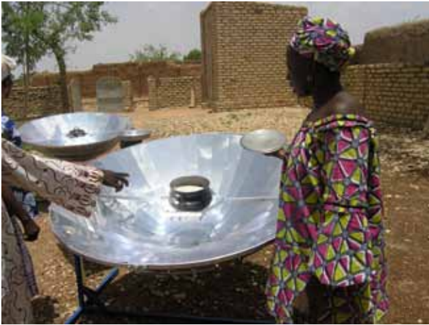
Abb. 9: SK14-Kocher im Einsatz, hier in Mali

Ein Beispielprojekt in Madagaskar wird gleich näher beschrieben. Informationen zu Projekten, die an Karlsruher Schulen mit SK14-Kochern durchgeführt wurden, folgen auf Kapitel 4.