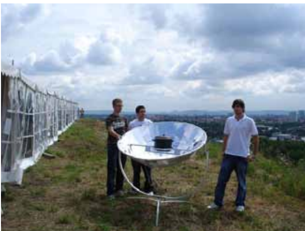
Abb. 18: Schüler in Karlsruhe mit Solarkocher