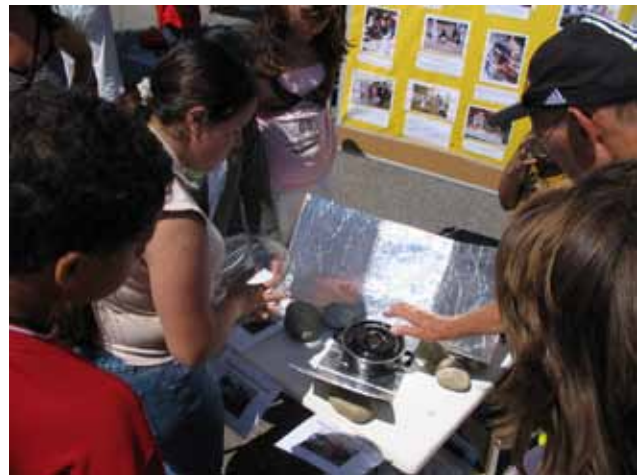
Abb. 19: Ein Lehrer erklärt die Funktionsweise eines Solarkochers

Beim Agenda-Büro der LUBW Landesanstalt für Umwelt, Messungen und Naturschutz Baden-Württemberg ist zudem das Infoblatt „Lernen mit Solarkochern: Erneuerbare Energien und Eine-Welt“ erhältlich. Es enthält eine kommentierte Zusammenstellung von Broschüren, Büchern, Filmen und Unterrichtseinheiten, mit denen das Thema in der Schule ergänzt werden kann unter: www.lubw.baden-wuerttemberg.de/servlet/is/30366 ).