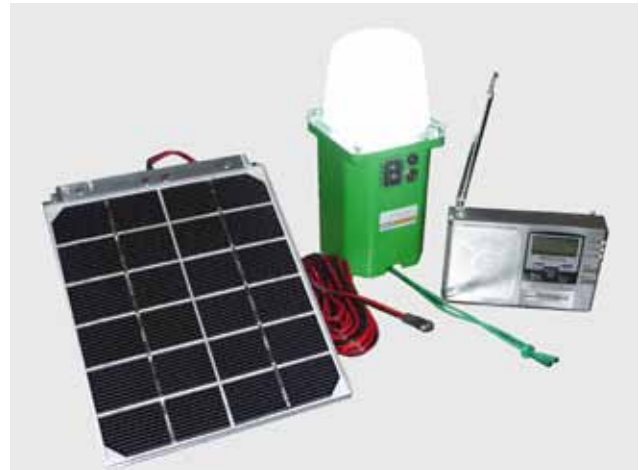
Abb. 5: Das aktuelle Modell des mobilen Solarlampensystems "SOLAR 2007-2", eine LED-Leuchte mit Solarmodul und Radio.

Solarprojekt Freilassing e.V. Siegfried Popp Predigtstuhlstr. 46 83395 Freilassing Tel. 08654/ 27 49 E-Mail: siegfried.popp@t-online.de Internet: www.solarprojekt-freilassing.de