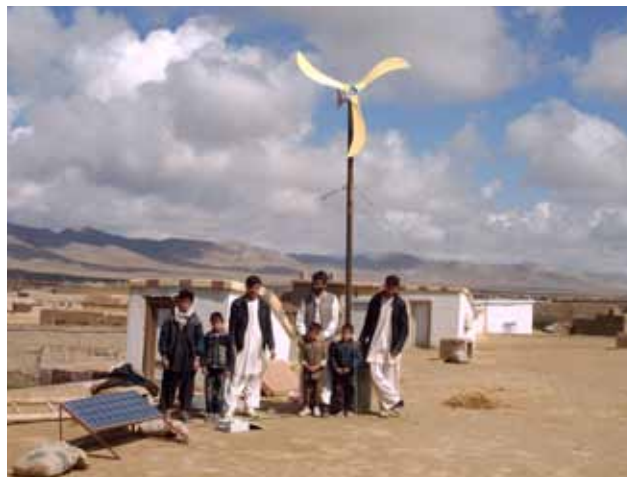
Abb. 15: Angepasste Technologie in einem Land mit viel Sonne und Wind.

die Verbreitung erneuerbarer Energien in Afghanistan und setzt dabei auf die Zusammenarbeit von deutschen und afghanischen Experten und Organisationen und auf internationale Vernetzung. Im Zentrum steht die Hilfe zur Selbsthilfe: Wichtiges Ziel ist die Aus- und Weiterbildung von einheimischen Fachkräften vor Ort in Afghanistan.