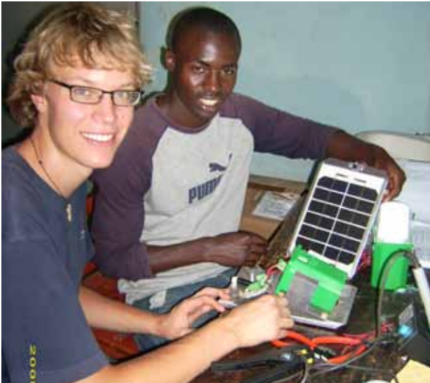
Abb. 7: Lampenmontage.

Projektbeteiligte: Burundikids konnte bei diesem Projekt auf das technische und organisatorische Know-how des Solarprojekts zurückgreifen. Burundikids selbst ist ein gemeinnütziger, konfessionell und politisch unabhängiger Verein mit Sitz in Euskirchen. Sein Ziel ist, Kindern in Burundi die Chance auf eine lebenswerte Zukunft zu geben. Die Kinderhilfsorganisation, 2003 von einem seither stetig wachsenden privaten Förderkreis ins Leben gerufen, arbeitet seit ihrem Bestehen eng mit der Fondation Stamm zusammen. So half auch bei diesem Projekt ein dortiger Mitarbeiter beim Aufbau der Werkstatt und des Mietsystems; zudem ist die Werkstatt inzwischen in der Schule der Fondation untergebracht.