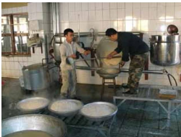
Abb. 16: Kochen mit solar erzeugtem Wasserdampf.

Als Technik der Wahl kamen Scheffler-Reflektoren zum Einsatz, wie sie bereits seit einigen Jahren in der lokalen Solarwerkstatt des ABS in Kabul hergestellt werden. Diese sind an die Bedingungen vor Ort angepasst: viel Wind, Staub und Sand. So verwendet der ABS zum Bau der Parabolspiegel kleine Glasspiegel, die zwar einen etwas geringeren Wirkungsgrad besitzen als die üblicherweise eingesetzten hochglanzpolierten Reflektorteile aus Leichtmetall, die dafür aber deutlich robuster und kratzfest sind. Zudem entfallen teure Importe: Die Glasspiegel können für ca. 20 Cent pro Stück günstig im Inland beschafft werden.