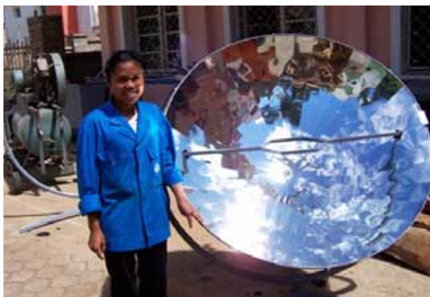
Abb. 10: Solarkochereinsatz in Madagaskar