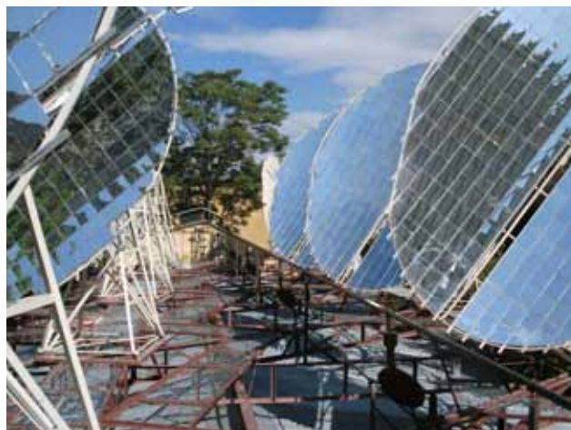
Abb. 17: Energiesammler auf dem Dach des Jamhuriat-Gymnasiums, das mit diesen in Reihe geschalteten Kraftpaketen seine eigene solare Großküche betreibt.

Afghan Bedmoschk Solar Centre e.V. Sabur Achdari Im Käppelefeld 37 79189 Bad Krozingen Tel. 07633/ 94 97 06 E-Mail: m.s.achtari@web.de Internet: www.afghan-solar.org