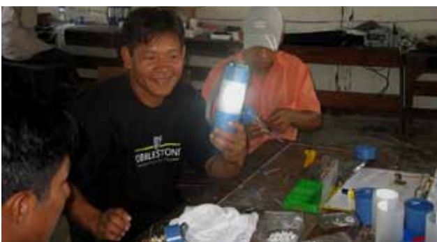
Abb. 2: Unter fachkundiger Anleitung werden die Leuchten selbst zusammengebaut.

Partnerorganisation vor Ort ist die Asociación Casa Lupuna, San Martin; sie übernimmt die Durchführung des Pro-