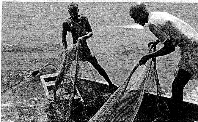
Der Fischfang am Tanganjikasee bringt umgerechnet 70 Cent am Tag – wenn man Glück hat.

Oben in den Bergen von Mutumba, eine Fahrtstunde von Bujumbura, wird Nahrung verteilt. Einmal die Woche hält ein Lastwagen der amerikanischen Helfer von USAID